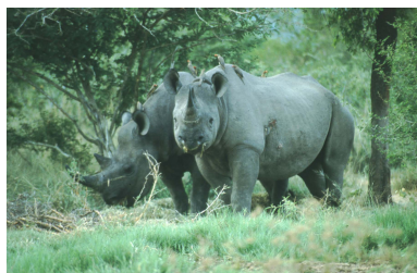
Abb. 4. Weibliches Südliches Spitzmaul-Nashorn aus dem Kruger National Park in der Eingewöhnungsboma im sambischen North Luangwa National Park.