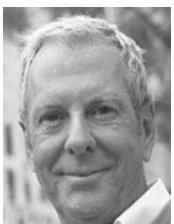
Kurt Aeschbacher Moderator Fernsehmoderator

Studium der Veterinärmedizin an der Universität Zürich. Dissertation «Tod durch Verhalten bei Zootieren» unter Leitung von HEINI HEDIGER. Assistent an den Zoos von Zürich und Mülhausen und am Institut für Parasitologie Zürich. 1974-2001 Tätigkeit beim Bundesamt für Veterinärwesen in verschiedenen Funktionen, zuletzt als Abteilungsleiter Bewilligungen und Kontrollen. 2001-2008 Geschäftsführender Direktor der WAZA. 2009-2015 Geschäftsführer des Verbands der Zoologischen Gärten in Teilzeit. 2001 bis heute Sekretär von zooschweiz .